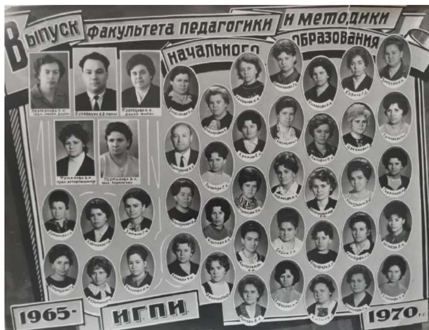
Фото студентов заочного отделения 1965-1970 гг.