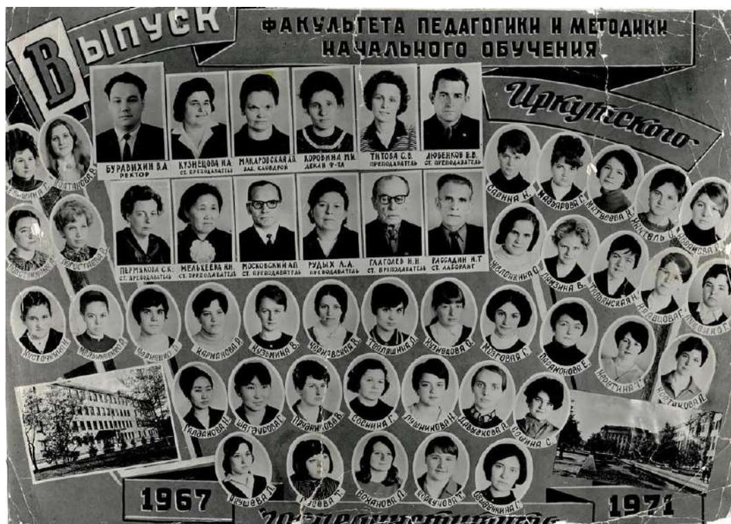
Выпуск 1967-1971 гг.