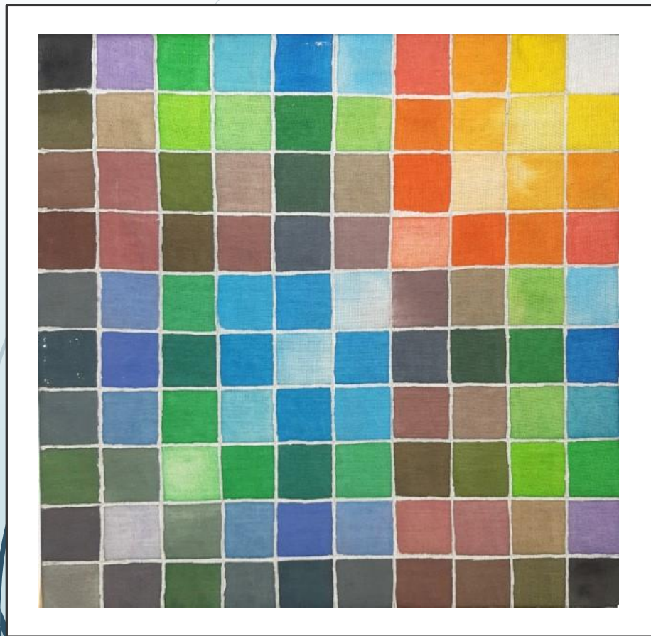
«Сетка» 30x30 Холодный батик