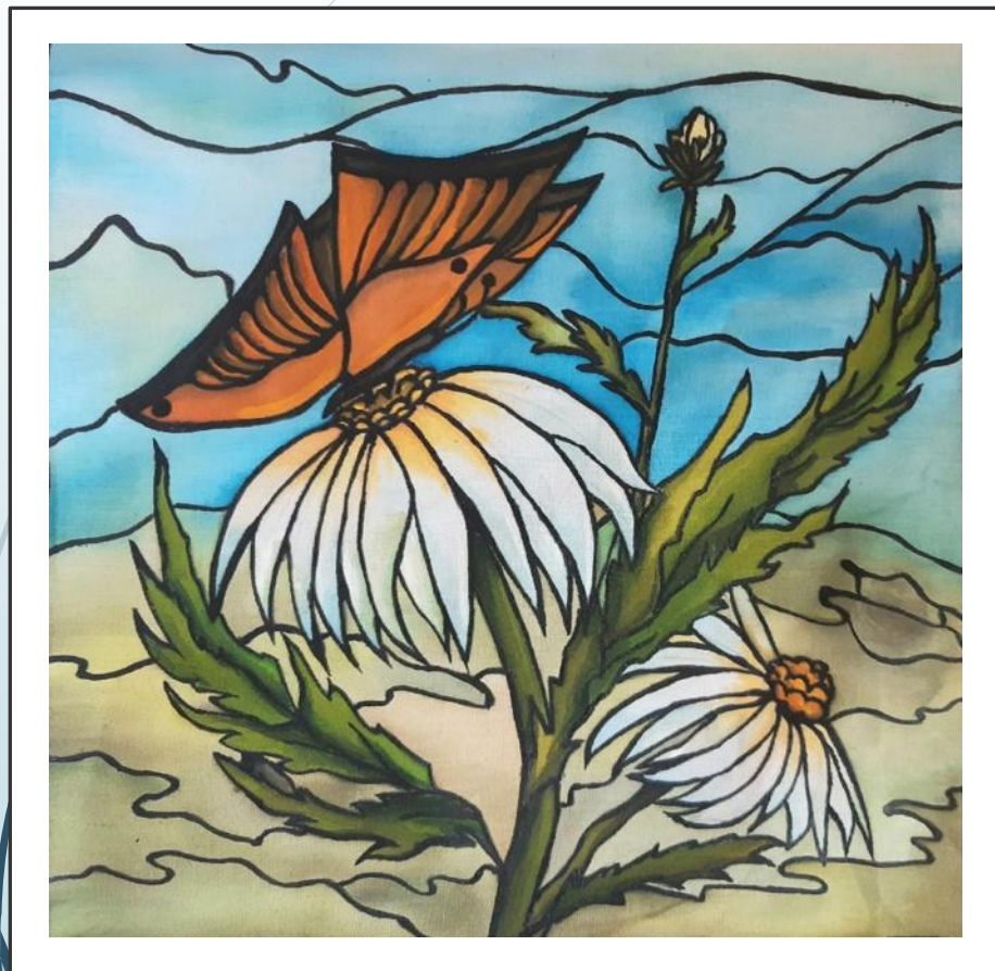
«Бабочка» 30x30 Холодный батик