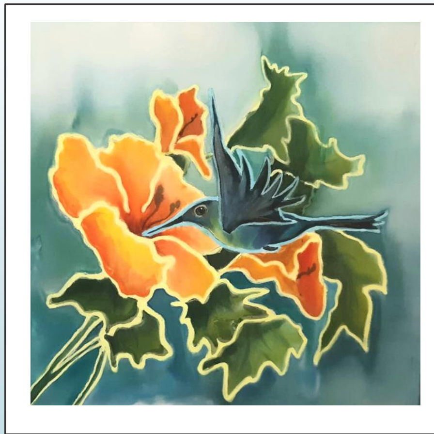
«Колибри» 30x30 Холодный батик