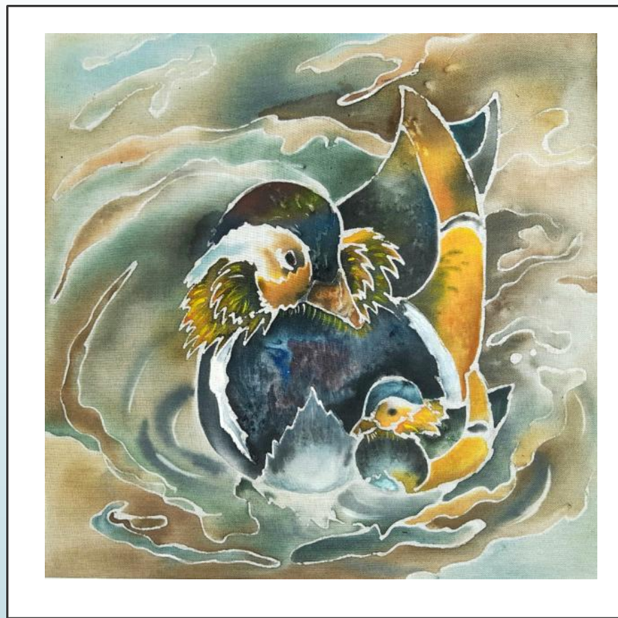
«Семейная идиллия» 30x30 Холодный батик