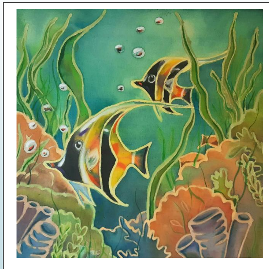
«Подводный мир» 30x30 Холодный батик