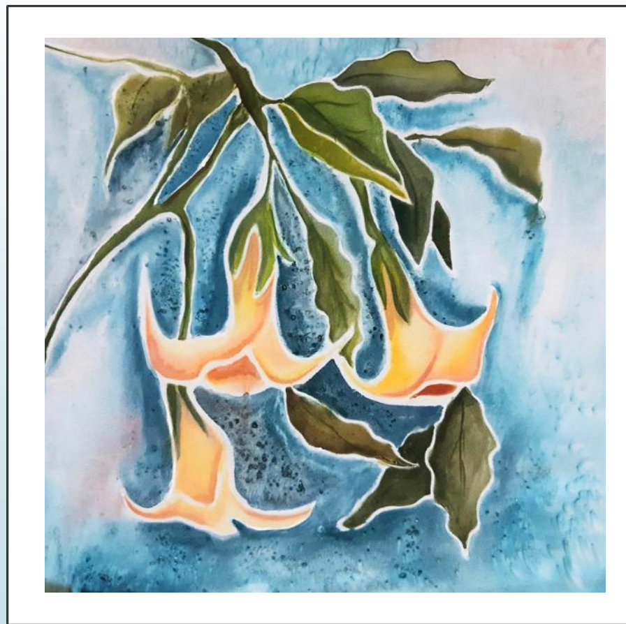
«После дождя» 30x30 Холодный батик