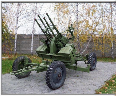
Рис. Пример словарного слова