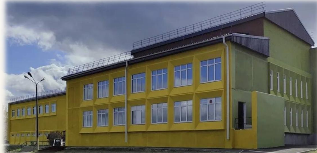
МОУ Школа № 1 г. Черемхово