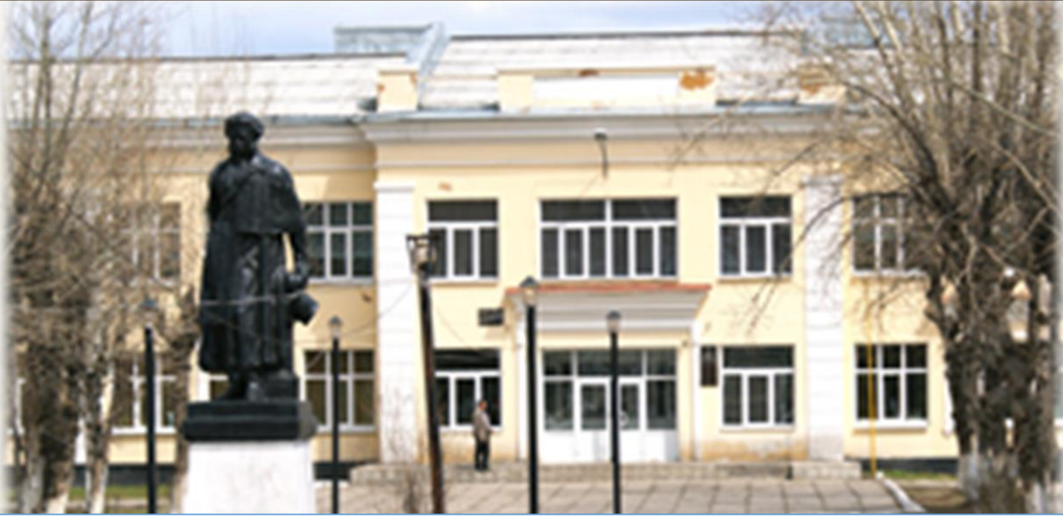
МОУ Школа № 8 г. Черемхово