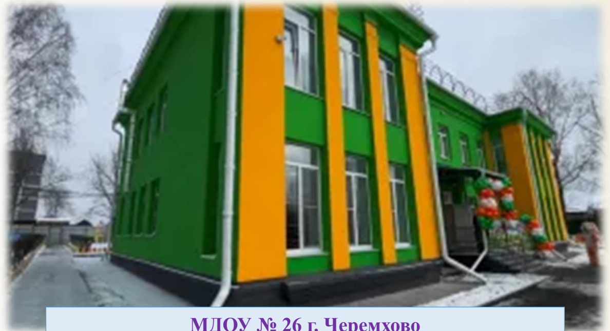
МДОУ № 26 г. Черемхово