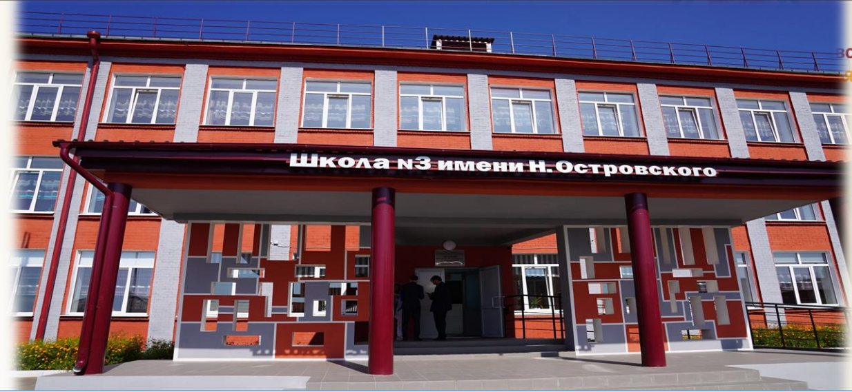
МОУ Школа № 3 г. Черемхово