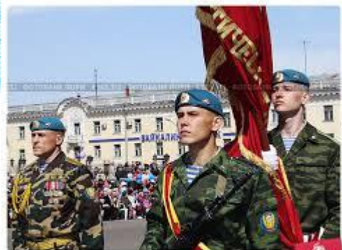
Знаменосцы школы «Мужество» на параде 9 Мая. Ангарск.