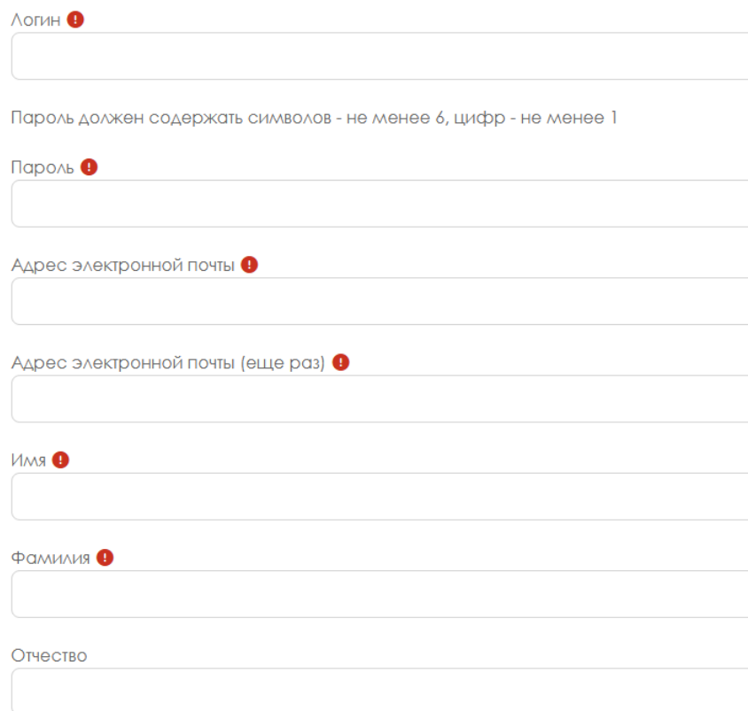
Рис. 2. Основные поля анкеты участника