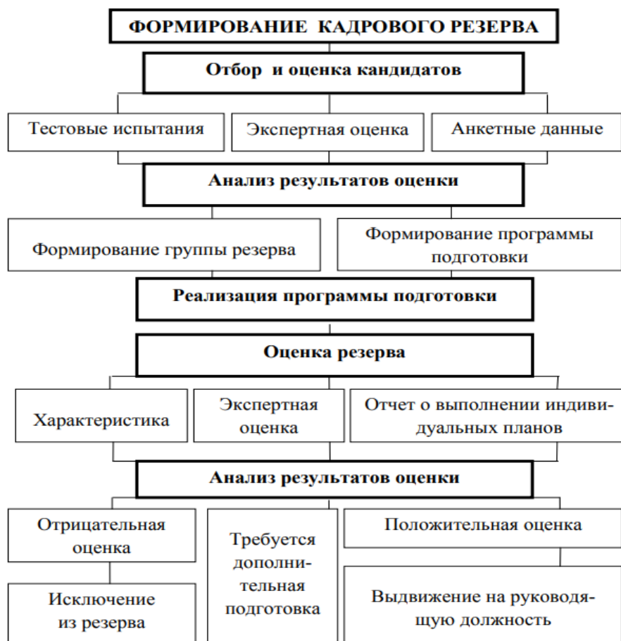
Рис. 1. Формирование кадрового резерва

Таким образом, кадровый резерв представляет собой группу квалифицированных специалистов, готовых занять ключевые позиции в организации при возникновении таких потребностей. Выделяют различные виды классификаций кадрового резерва (по виду деятельности, по времени назначения, по уровню конкретизации, по категории персонала, по источникам отбора), а также разработаны этапы его формирования. Мы полагаем, кадровый резерв управленческого аппарата в специальных (коррекционных) образовательных учреждениях является важным инструментом для повышения качества образования и обеспечения устойчивого развития. Эффективная система формирования и управления кадровым резервом обеспечит не только успех учреждения, но и, прежде всего, улучшение условий для обучения и развития детей с особыми образовательными потребностями.